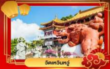
วัดเหวินทู่