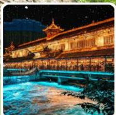
Blue Tears สะพานหนานเฉียว