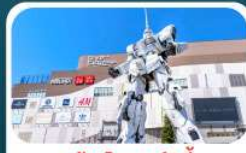
ห้างไดเวอร์ซิตี