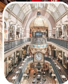
QUEEN VICTORIA BUILDING