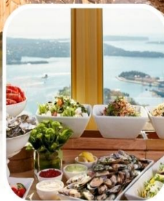
SKYFEAST BUFFET SYDNEY TOWER