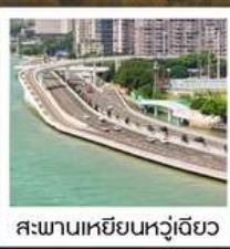
สะพานเหยียนหู่เฉียว

1 ประเทศ 2 ระบบ ในทริปเดียว!! ข้ามทะเลจากจีน...สู่จินเหมิน (ใต้หวัน)