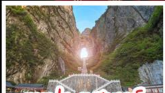
เขาประตูลั่วจื่อ