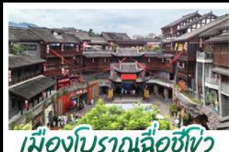
เมืองโบราณฉือซีโจว

อุทยานสีครุณี - อุทยานเขานางฟ้า อุทยานหลุมบ่อฟ้า - เมืองโบราณฉือซีโจว หลงหยินเทียนเจิง - หงหยาดัง