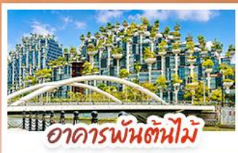
อาคารพันตันใหม่