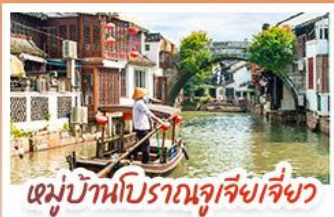
หมู่บ้านโบราณจูเจียงเจี๋ยว

สวนสนุกเซี่ยงไฮ้ดิสนีย์แลนด์ เต็มวัน (รวมรถรับ-ส่ง)