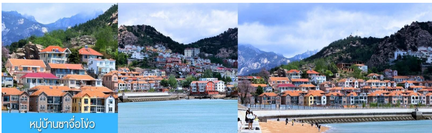
หมู่บ้านชาวโจว