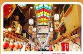
ตลาดปลาชิชิ