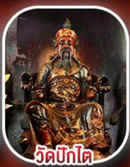
วัดปิกไต่