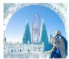
ICE & SNOW FEST.