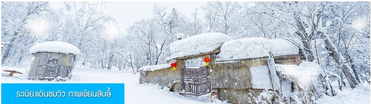
ระเบียบเดินชมวิว ภาพเขียนสิบลิ

จากนั้นให้ท่านอิสระ ตามอัชฌาศัย หรือ ไกด์ท้องถิ่นนำเสนอโปรแกรมเสริม หรือ OPTIONAL TOUR ให้ท่านเลือกตามความสมัครใจ ***อิสระอาหารกลางวัน และ อาหารค่ำ เพื่อให้ท่านสะดวกในการพักผ่อนอย่างเต็มสุข