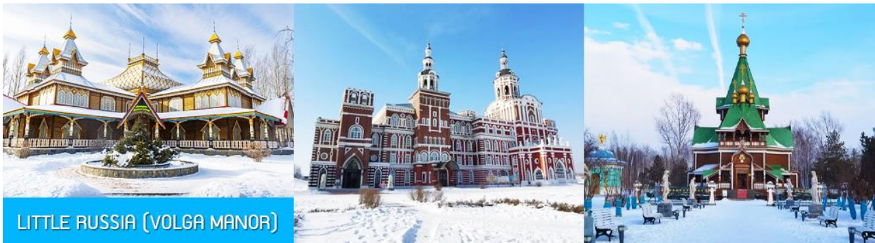
LITTLE RUSSIA (VOLGA MANOR)

รับประทานอาหารเช้า ณ ห้องอาหารของโรงแรม (13)