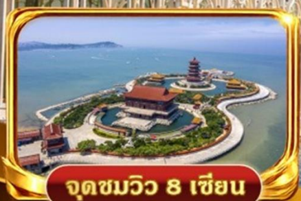
จุดชมวิว 8 เชียง