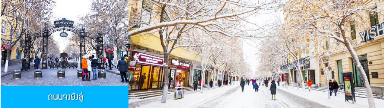
ถนนจางยงลู่

จากนั้นนำท่านเที่ยวชม ถนนจางยงลู่ 中央大街 ถนนสายหลักของเมืองฮาร์บิน ถนนที่เต็มไปด้วยอาคารบ้านเรือนที่เป็นสถาปัตยกรรมตะวันตกที่สร้างในช่วงคริสต์ศตวรรษที่ 18 – 19 ที่เมืองนี้ถูกปกครองโดยรัสเซีย อีกทั้งเป็นถนนคนเดินที่เป็นแหล่งรวมร้านค้าสินค้าแบรนด์เนมทั้งในและต่างประเทศ ร้านจำหน่ายของที่ระลึกและสินค้าพื้นเมือง ร้านอาหารพื้นเมืองต่าง ๆ มากมาย ให้ท่านมีเวลาอิสระเดินเที่ยวและช้อปปิ้ง หรือลิ้มรสอาหารพื้นเมืองตามอัธยาศัย.. **ให้ท่านลิ้มรสไอศกรีมชื่อดังเก่าแก่ของเมืองฮาร์บินท่านละ 1 ท่านฟรี