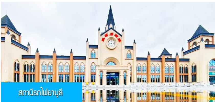
สถาบันรถไฟยาลู

หมายเหตุ เพื่อความสะดวกในการเข้าพักใน HOME STAY ภายในหมู่บ้านหิมะ ทางทัวร์แนะนำให้ท่านจัดเตรียมเสื้อผ้าและเครื่องใช้เท่าที่จำเป็น 2 ชุดใส่กระเป๋าใบเล็กหรือเป้แบบสะพายได้ เพื่อสะดวกในการนำติดตัวไปใช้สำหรับคืนที่นอนในหมู่บ้านหิมะ หากนำกระเป๋าเดินทางใบใหญ่เข้าสู่ที่พักในหมู่บ้านอาจสร้างความไม่สะดวกแก่ท่าน จึงไม่แนะนำ