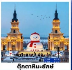
ตึกตาคิมะฮักซ์