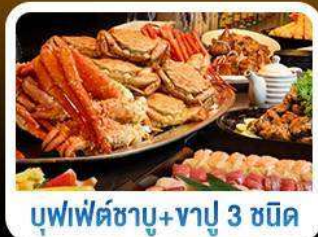
บุฟเฟ่ต์ชาบู+ชาปู 3 ชนิด