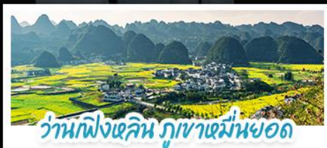
ว่านฟิงหลิน ภูเขาเขม่านยอด