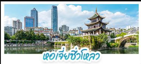
หอเจียงซิวโหลว

ผ่านชมสะพานหุบเขาฮวาเจียง สะพานแขวนที่สูงที่สุดในโลก ชมปราสาทลับคีสบีย์ XINGYI JILONGBAO CASTLE แห่งมณฑลกุ้ยโจว น้ำตกหวงกู่ (รวมบันไดเลื่อน) • ชมหอเจียงซิวโหลว (JIAXIU TOWER) สัญลักษณ์และแลนด์มาร์กสำคัญของเมืองกุ้ยหยาง มณฑลกุ้ยโจว