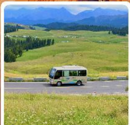
ทุ่งหญ้าเจียนปูลาเค่อ