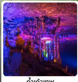
ตำเก้าทพ