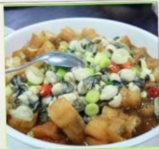
ถนนโบราณสีเฟิน