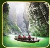
ล่องเรือแม่น้ำไตคินกุฮิว