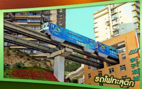
รถไฟฟ้าลัด