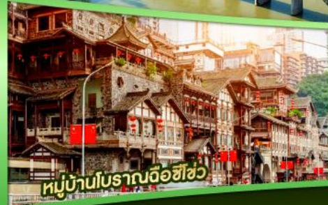
หมู่บ้านโบราณฉือฮิว