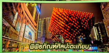
พิพิธภัณฑ์ศิลปะตะเกียบ