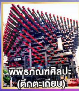
พิพิธภัณฑ์ศิลปะ- (ตักตะเกียบ)