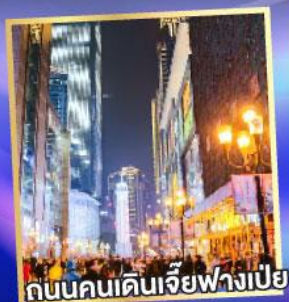
ถนนคนเดินเจียงฟางเป็ย