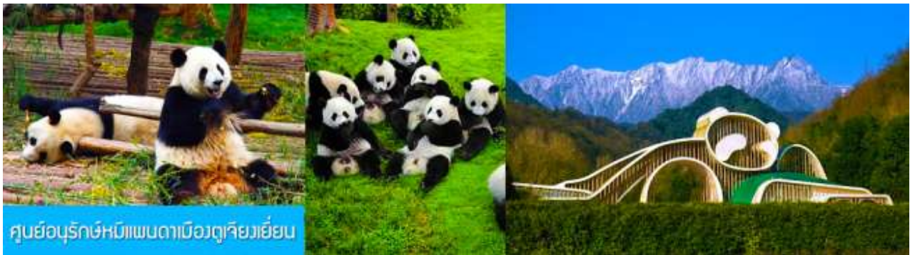
ศูนย์อนุรักษ์หมีแพนด้าเมืองตูเจียงเย็น

เช้า รับประทานอาหารเช้า ณ ห้องอาหารของโรงแรม (7) หลังอาหารท่านสามารถเลือกที่จะซื้อโปรแกรมทัวร์เสริม หรืออิสระพักผ่อนตามอัธยาศัยในโรงแรม