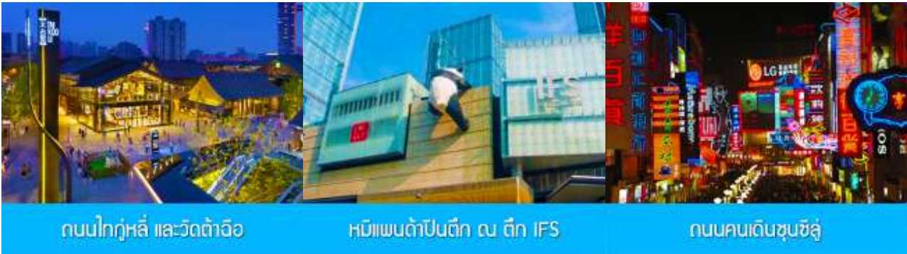
ถนนไท่กุ่หลี่ และวัดต้าอ้อ