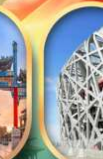
ผ่านชมสนามกีฬาาริงนก