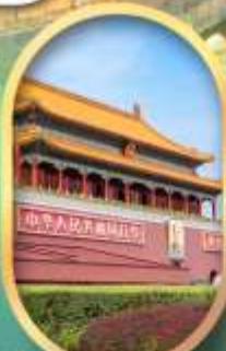
จัสมุตรีสเทียนอันเหมิน