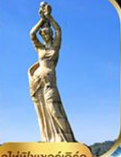
จูไห่ฟิชชอร์ทรีซ่า