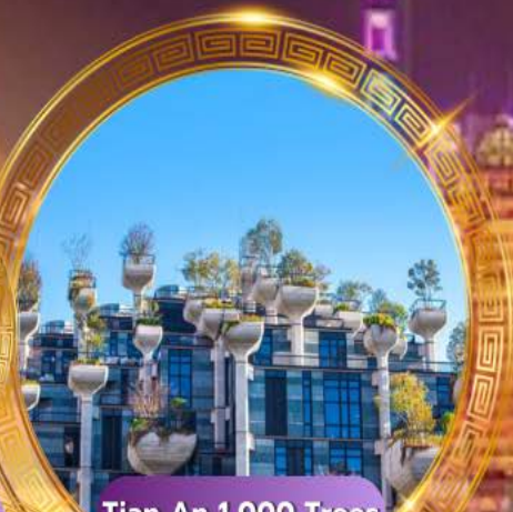
Tian An 1,000 Trees