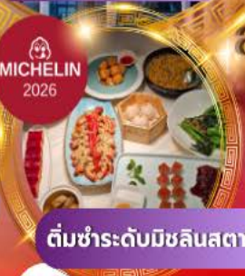
ติ่มซำระดับมิชลินสตาร์

สัมผัสทัศนียภาพเซี่ยงไฮ้ เช็กอินแลนด์มาร์คล้ำยุค ล่องเรือเมืองเก่าจูเจียเจี้ยว พักหรู 5 ดาว ครบจบในทริปเดียว