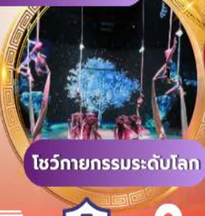
โชว์กายกรรมระดับโลก