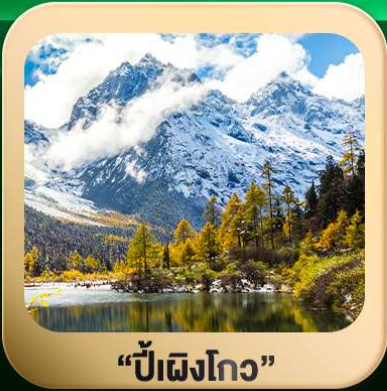
“ปี้ผิงโกว”

ชมธรรมชาติ 2 อุทยานขึ้นชื่อ อุทยานภูเขาสี่ดรุณี + อุทยานปี้ผิงโกว สะพานหนานเฉียว • ถนนคนเดินไท่กู่หลี่ + ซุนซีลู่ + Pop Mart • ตงเจียวจื่อ