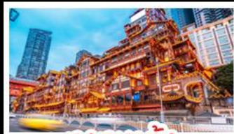
เฉิงเฉียวต้ง

อุทยานหุบหม่นบ่อฟ้า - อุทยานเขานางฟ้า หงหยาดัง - นั่งรถไฟทะเลสาบ - อุทยานสี่ดรุณี ป่าผิงโกว - สะพานหนานเฉียว