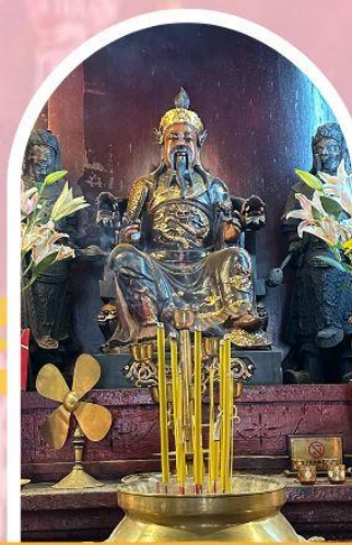
วัดปักไต้ฮ่องกง