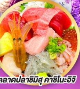
ตลาดปลาชิบึสึ คาชิโนะอิชิ