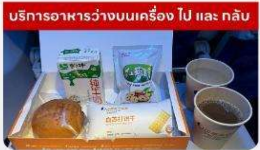
บริการอาหารว่างบนเครื่อง ไป และ กลับ