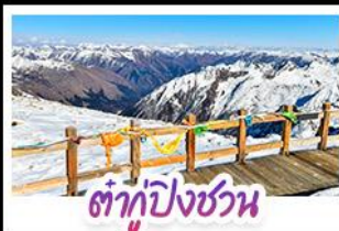
ต้ากูปิงชวณ