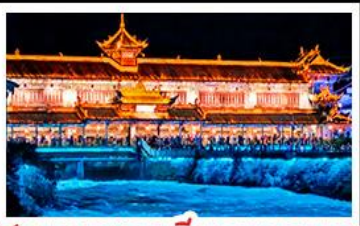
สะพานหนานเฉียวBLUE TEARS

สวนม่านงา - อุทยานหลุมฟ้าสะพานสวรรค์ ลีดรุณี - หงหยาดัง - รถไฟฟ้าทะเลลึก สะพานหนานเฉียว BLUE TEARS พักโรงแรมระดับ 4 ดาว - ไม่ลงร้านช้อปปิ้ง เมนูพิเศษ สุกี้หมาล่า เปิดปิกนิก