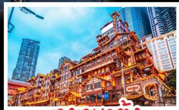
แสงฉายตัง