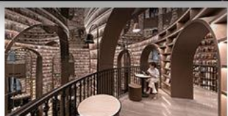
ร้านหนังสือจขูเก้อ

อุทยานภูเขาสี่ดรุณี อุทยานปี้เฟิงโกว หมู่แพนด้าอนแซลพี ร้านหนังสือจขูเก้อ วัดต้าฉือ ถนนโบราณความจำ ช้อปปิ้งย่านคิง ถนนไท่กู่หลี่ + ถนนซุนซู่ เมนูพิเศษ สุกี้หมาล่าเสวน