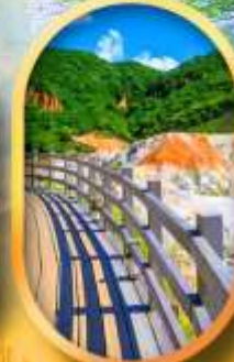
โนโบริเบทส์