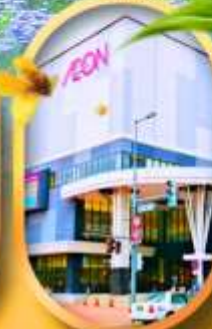
อออนมอลล์