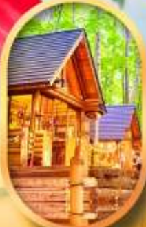
บึงเกลือเกษตร