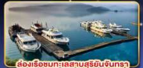
ส่องเรือชมทะเลสาบสุริยอันจินตรา