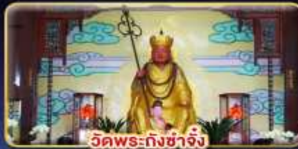
วัดพระกั๋งซาจิง