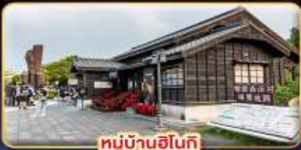
หมู่บ้านฮินกิ

"ไทเป" มหานครแห่งเมืองสี่พัน เที่ยวจุใจ เช็กอินจุดไฮไลท์