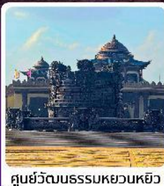
ศูนย์วัฒนธรรมหยวนหยิว