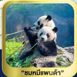
"ชมหมีแพนด้า"