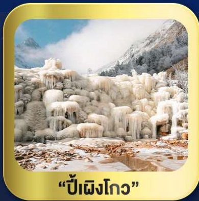
"ปี้ฝิงโกว"

นั่งกระเช้าชมวิว ภูเขาหิมะ-ต้ากู่กลาเซียร์ • ชมความสวยงาม ณ อุทยานปี้ฝิงโกว ห้องสมุดจงซูเก๋อ • ศูนย์หมีแพนด้า • ตงเจียวจี้ • ซอยกว้างชวยเคบ