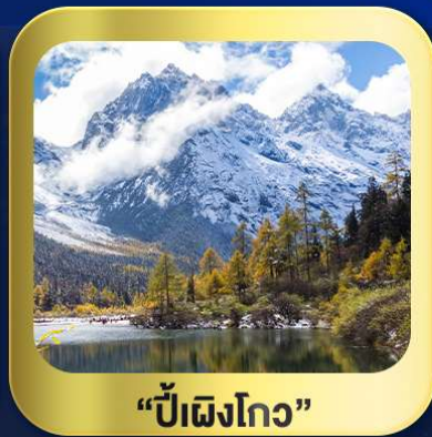
"ปี้ฝิงโกว"