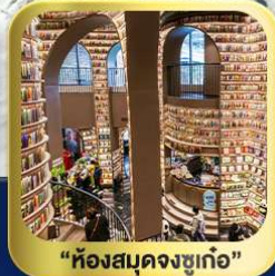
"ห้องสมุดจงซูเก๋อ"