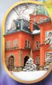
ศาลาว่าการฮอกไกโด