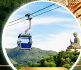
รวมกระเช้าฮ่องกง