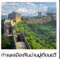
กำแพงเมืองจีนด่านปู่เทียนฮั่ว