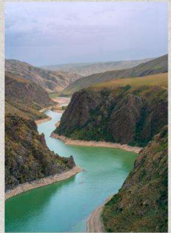
แกรนด์แคนยอนคุโคซู