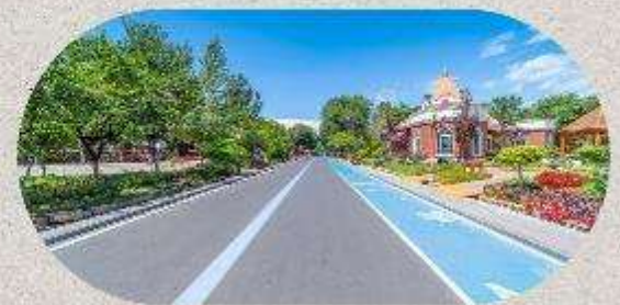
หมู่บ้านโบราณอุยกูร์คาจันจี