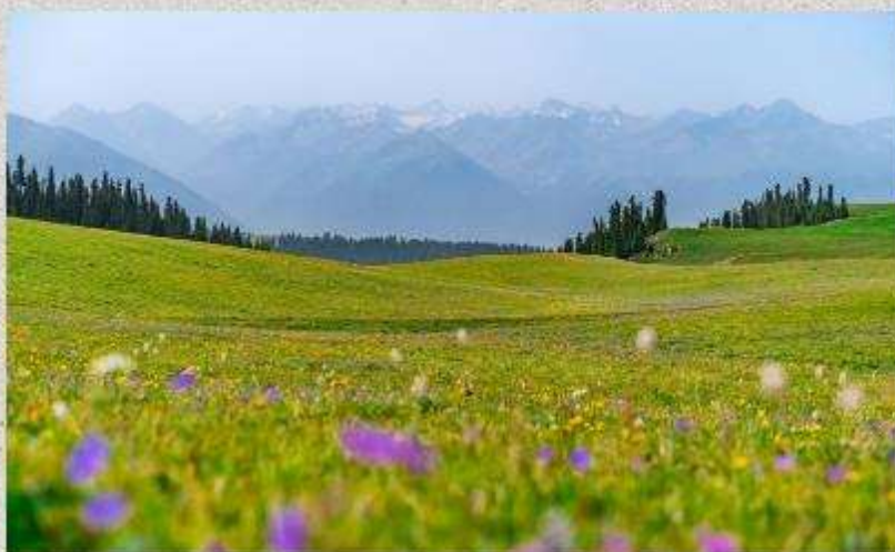
ทุ่งหญ้าคารา