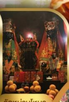
วัดบ้านใหม่