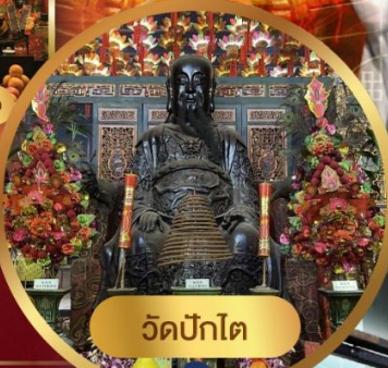
วัดปักโต