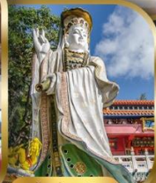
เจ้าแม่กวนอิม ริพลัสเบย์