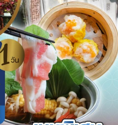
เจ้าแม่กวนอิม ริพลัสเบย์