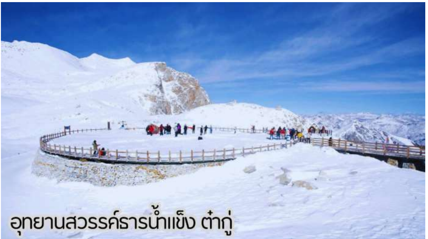
อุทยานสวรรค์ธารน้ำแข็ง ต่ากู๋

นำท่านเดินทางสู่ อุทยานสวรรค์ภูผาหิมะการ์เซีย “ต่ากู๋ปิงชว่น” ถือได้ว่าเป็นอุทยานสมบัติทางธรรมชาติที่ล้ำค่าของมณฑลเสฉวน ที่มีความงามไม่แพ้อุทยานและทะเลสาบใดในโลกมนุษย์ อุทยานสวรรค์ภูผาหิมะการ์เซีย “ต่ากู๋ปิงชว่น” ถูกค้นพบผ่านดาวเทียมเมื่อปี ค.ศ. 1992 โดยนักวิทยาศาสตร์ชาวญี่ปุ่น หลังจากได้ตรวจสอบพื้นที่จึงทราบว่าที่เป็นธารน้ำแข็งที่ตั้งอยู่ต่ำที่สุด ใหญ่ที่สุด และอายุน้อยที่สุดในโลก และยังคงตั้งอยู่ไม่ไกลจากตัวเมืองทำให้สามารถเดินทางไปท่องเที่ยวได้ง่าย ซึ่งคนในพื้นที่มีความเชื่อว่าภายในธารน้ำแข็งแห่งนี้มีเทพเจ้าศักดิ์สิทธิ์พิทักษ์อยู่ จึงทำให้ไม่มีใครสามารถพิชิตยอดเขาแห่งนี้ได้ จุดที่สูงที่สุดมีความสูงจากระดับน้ำทะเลประมาณ 5,286 เมตรเป็นภูเขาน้ำแข็งที่ศักดิ์สิทธิ์ ชาวบ้านเชื่อว่ามีเทพเจ้าพิทักษ์ภูเขานี้ทำให้ภูเขานี้ยังมีคนมีใครพิชิตยอดเขาได้