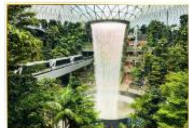
• HSBC Rain Vortex