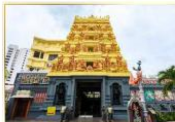
• Sri Senpaga Vinayagar Temple