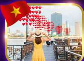
เช็คอินสะพานแห่งความรัก