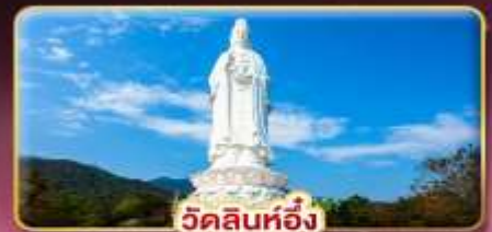
วัดลินทอ้ง