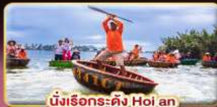
นั่งเรือกระดิง Hoi an