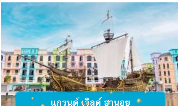
แกรนด์ เวิลด์ ฮานอย