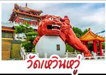
วัดเหวินหู

อาลีซาน - ทะเลสาบสุริยอันจินกรา - ไทเป101 วัดเหวินหู - อนุสรณ์สถานเจียง ไคเชก วัดหลงซาน - ตลาดกลางคืนซีเหมินติง เมบู หมอหนึ่งจักรพรรดิ - เขียวหลงเป่า - ซาบูไต้หวัน